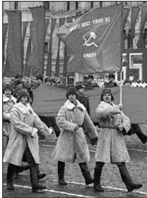
Από πρόσφατη παρέλαση του στρώ του "τοφ μαπ-αγερ" Πούτιν κάτω από κομμουνιστικά σύμβολα